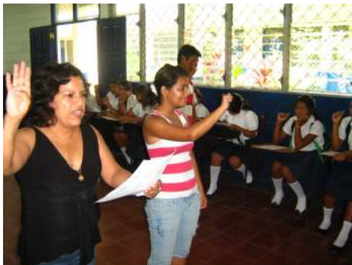
Kurs in Gebärdensprache

Zwei- bis dreimal in der Woche macht sich ein Team von Los Pipitos auf den Weg, um in den umliegenden Dörfern Familien mit behinderten Kindern zu besuchen, nach den Kindern zu schauen, die Familien zu beraten und über aktuelle Aktivitäten zu informieren. Wir begleiten die Mitarbeiter und besuchen einige der 35 Familien, die im letzten Jahr am Bettenbauprogramm teilgenommen haben.