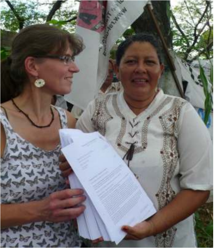
Unterschriften werden übergeben

der Regierung, Juan Ortega) übergeben. Dieser hatte im Gespräch zwar weitere Unterstützungsleistungen für die betroffenen Arbeiter in Aussicht gestellt, bisher wurde aber nur wenig davon eingelöst.