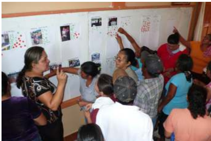
Was ist wichtig für mich und mein Kind - Die Befragung der Eltern und Angehörigen bei Los Pipitos

Das Nicaragua-Forum finanziert diese Aktivitäten neben den Personalkosten und den Kosten für den Betrieb der Einrichtung. Die Summe für das laufende Jahr beträgt 16.000 €. Spenden hierfür bitte unter dem Stichwort „ Los Pipitos “. (se)