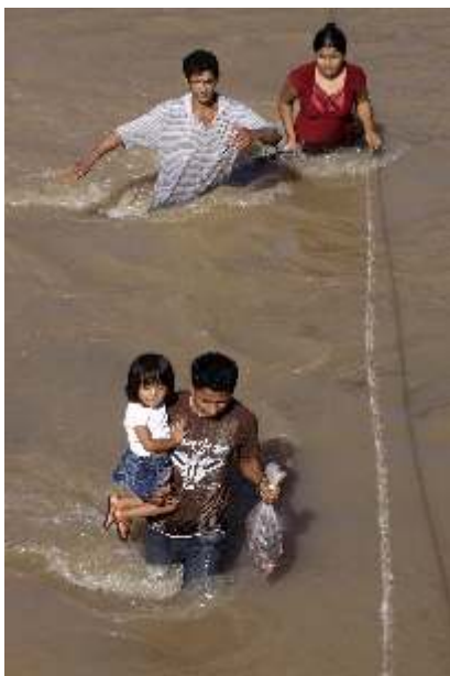
Überschwemmungen verursachte Rina in ganz Mittelamerika

Aber die mit dem Tropensturm einhergehenden Regenfälle führten in Nicaragua wie auch in einigen anderen mittelamerikanischen Ländern zu sehr großen Schäden. Über 5.000 Wohnhäuser wurden zerstört, Brücken und Straßen weggespült und 16 Menschen starben in Nicaragua aufgrund der Fluten. In anderen Ländern Mittelamerikas waren die Zahlen