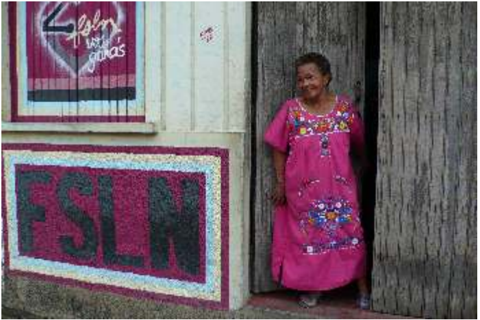
Eine überzeugten Anhängerin der Sandinisten.