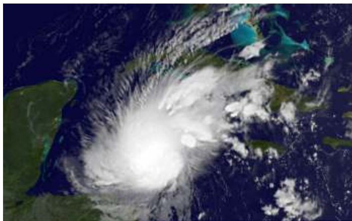
Hurrikan Rina in der Karibik

stärker besteuert, wird wahrscheinlich enttäuscht bleiben. Es spricht alles dafür, dass Ortega auch weiterhin versuchen wird, durch seine Politik massive Macht- und Verteilungskämpfe zu verhindern. Die Bedürfnisse der Armen werden zwar nicht im Zentrum aller Handlungen der Regierung stehen, aber zumindest mit bedacht werden. (rk)