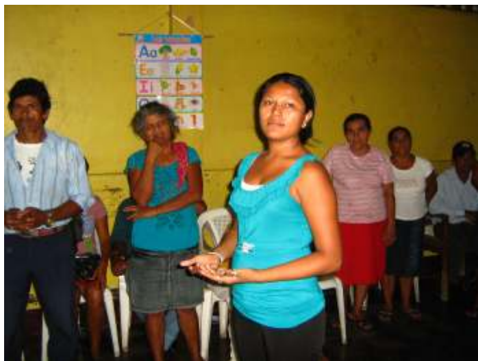
Veranstaltung für die IRC-Erkrankten mit der Psychologin

In diesem Jahr konnte eine weitere Renovierungsmaßnahme, die Reparatur der Türen, mit finanzieller Unterstützung des Walldorfer Vereins Hilfe zur Selbsthilfe durchgeführt werden. Weiterhin wurde ein Laptop und ein Beamer für die Vorträge im Frauenzentrum angeschafft.