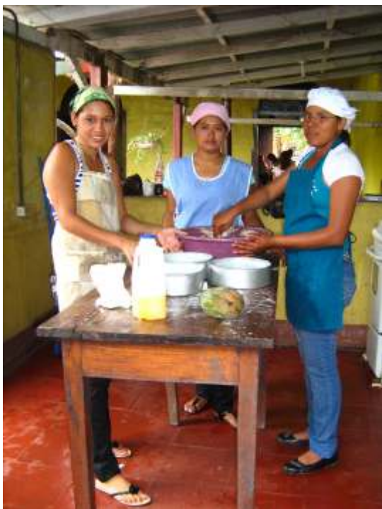
Koch- und Back-Kurs

Derzeit stellt das Frauenzentrum der Organisation der an Niereninsuffizienz erkrankten ehemaligen