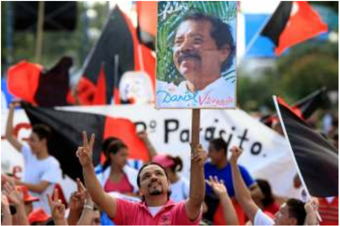
Feier der Sandinisten